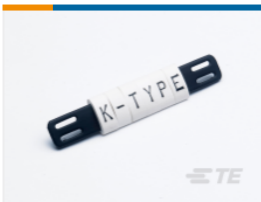
TE 产品编号 CAT-T3437-K1 K-Type Tie-On Markers