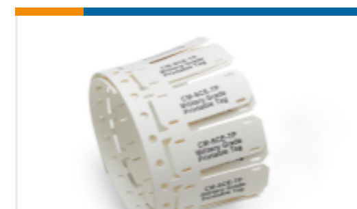
TE 产品编号 EL8598-000 CM-SCE-TP-1/2-6H-3