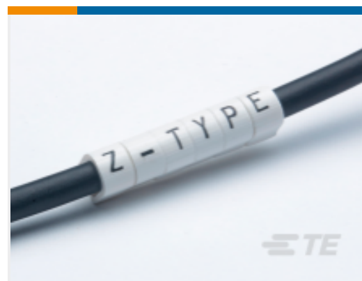
TE 产品编号 CAT-T3437-Z1 Z-Type Push-On Markers