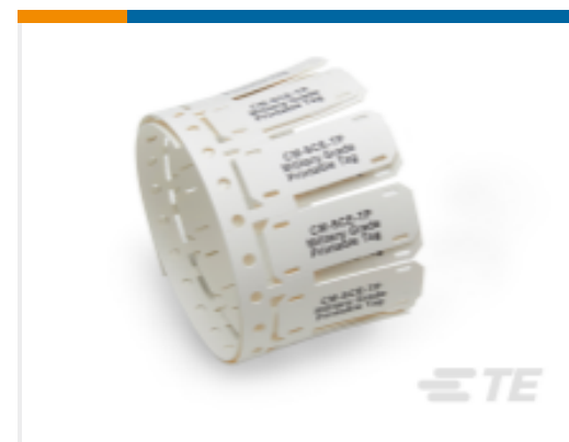
TE 产品编号 CAT-T3437-C6298 CM-SCE-TP Military Grade Markers