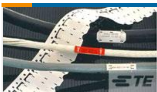
TE 产品编号 9305490001 HTCM-SCE-1/2-4H-4