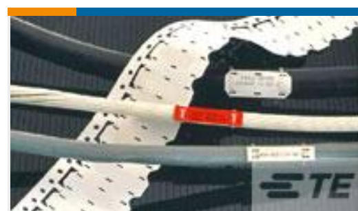
TE 产品编号 0479490001 HTCM-SCE-1/2-4H-9