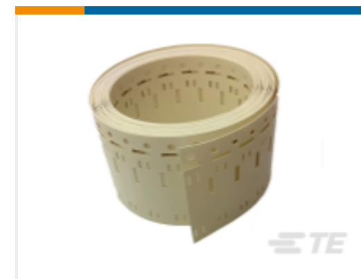
TE 产品编号 CAT-T3437-H85999 High Temperature Markers, HTCM-SCE-TP