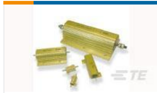
TE 产品编号1-1625999-4 HSC100 1R0 5%