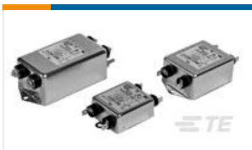
TE 产品编号1-1609034-9 20VSB1=F8333