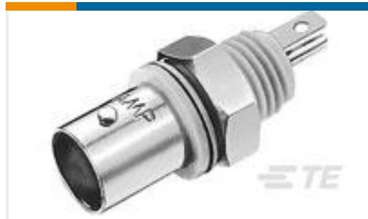
TE 产品编号5227726-2 ISOLATED BNC SOLDER JACK ASSY