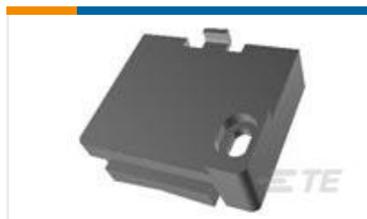
TE 产品编号1-640724-0 15P UMNL STR/REL & INSRT NATL