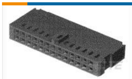
TE 产品编号102387-7 30 MODIV HSG COMP DR .100 POL