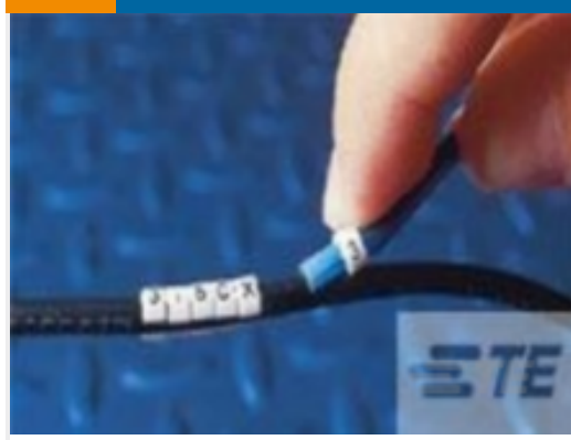
TE 产品编号4-1768045-3 STD12Y-R