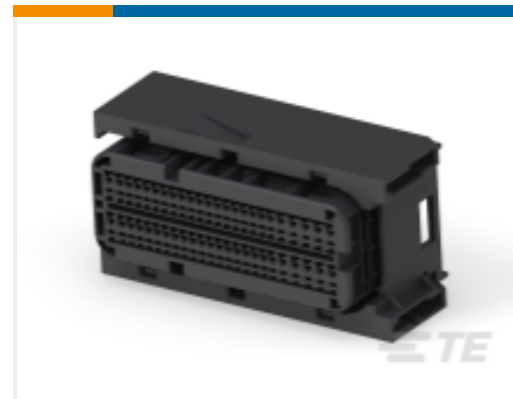
TE 产品编号8-1564284-5 96POS,MCON-1.2 CB,REC HSG,ASSY