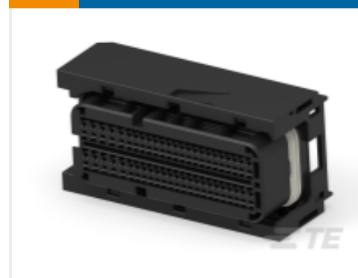
TE 产品编号2359941-6 96POS,MCON-1.2 CB,REC HSG,ASSY