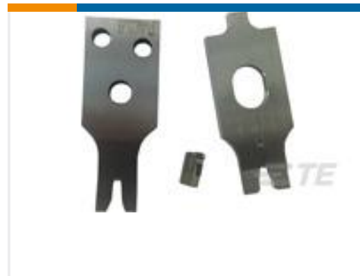
TE 产品编号7-2266379-7 OC-090F130F-752-CRIMPTOOLINGKIT