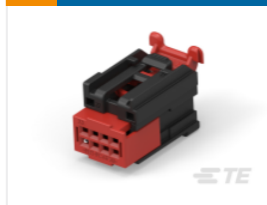
TE 产品编号1456987-1 2x4 Fem unsealed LP assy Key A