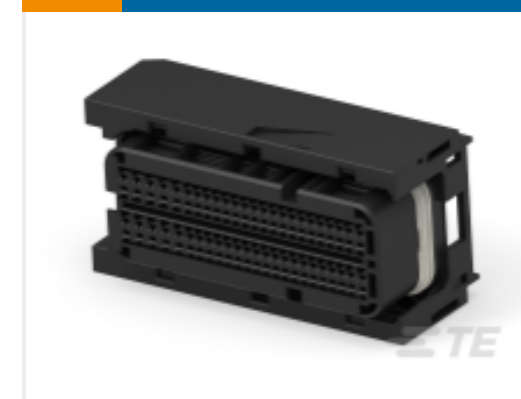
TE 产品编号2359943-1 96POS,MCON-1.2 CB,REC HSG,ASSY