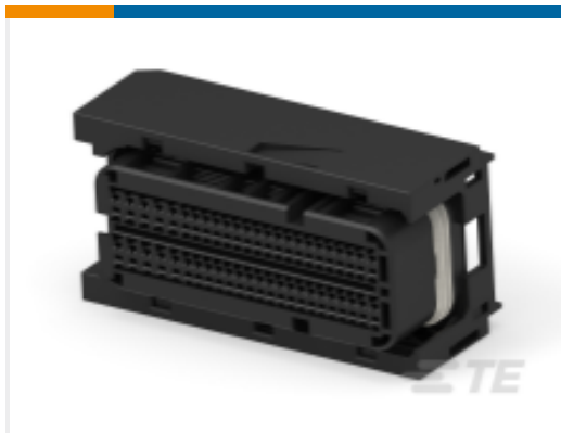
TE 产品编号2359943-2 96POS,MCON-1.2 CB,REC HSG,ASSY