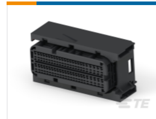
TE 产品编号8-1564284-6 96POS,MCON-1.2 CB,REC HSG,ASSY