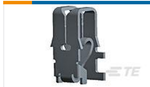
TE 产品编号964339-1 MAG MATE KONT. MKII