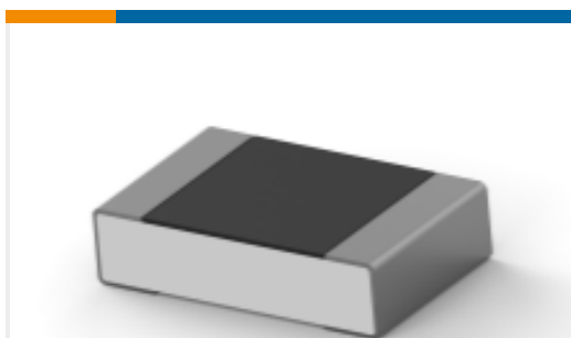
TE 产品编号9-2176374-8 RQ 0805 1K1 0.1% 10PPM 1K RL