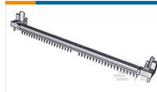
TE 产品编号5822138-4 80 ME .050 L/P AU M/L PB-FREE