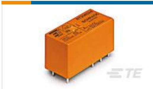
TE 产品编号2-1393243-4 RTE25524