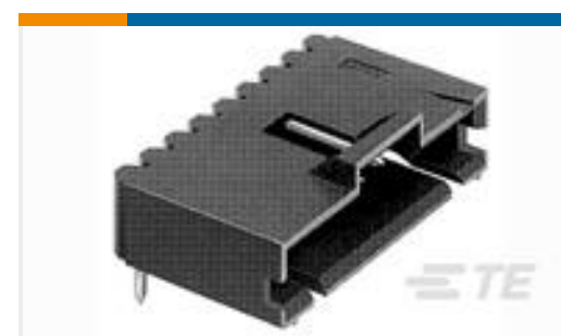
TE 产品编号103635-6 07 MTE HDR SRRA LATCH .100CL