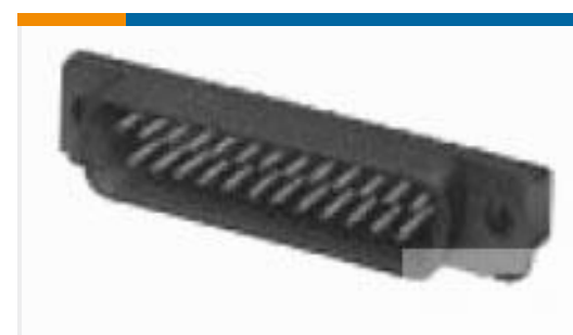
TE 产品编号745073-1 25 PLUG SP/AP SCRLK