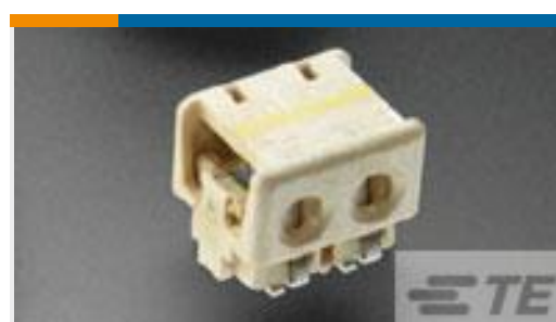
TE 产品编号2-2106003-2 Connector, SMT-IDC, 2 position, 22AWG