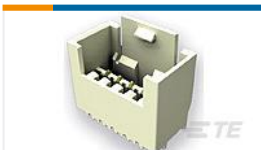
TE 产品编号1-1971819-3 3P,RAST 2.5 Tab Header,In- Locking, THV