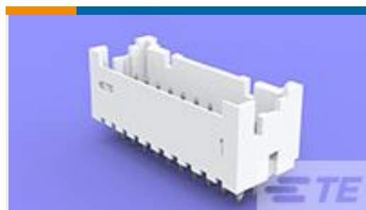
TE 产品编号1-1969543-4 ASSY, HDR, VERT, BOSSSED, DUAL ROW, EP2.5