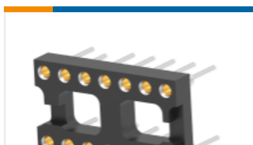
TE 产品编号2-1571552-5 DIP 插座：标准，冲压成型，开放式，镀金