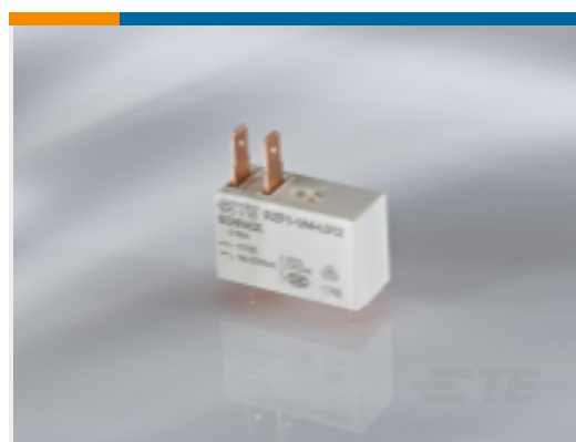
TE 产品编号1833011-6 RZF1-1A4-L024