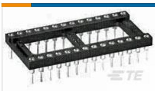
TE 产品编号2-1571552-4 816-AG11D-ESL-LF=800 DIP,GF/SN