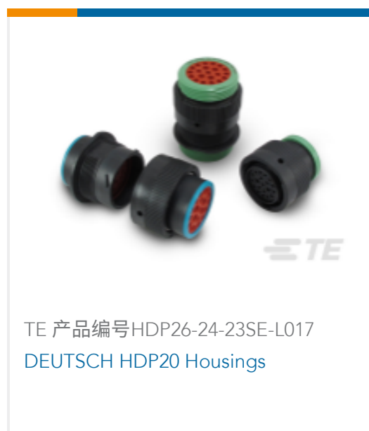
TE 产品编号 HDP26-24-23SE-L017 DEUTSCH HDP20 Housings