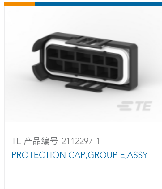
TE 产品编号 2112297-1 PROTECTION CAP, GROUP E, ASSY