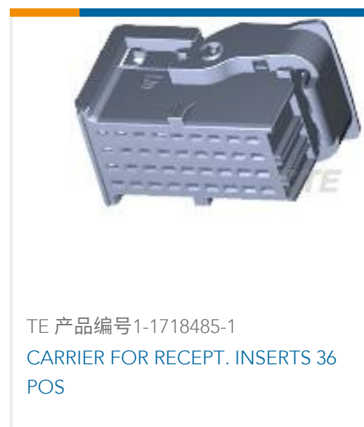
TE 产品编号 1-1718485-1 CARRIER FOR RECEPT. INSERTS 36 POS