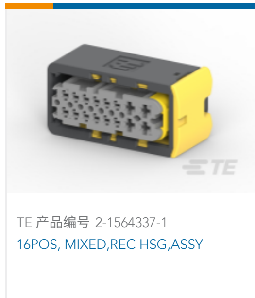
TE 产品编号 2-1564337-1 16POS, MIXED, REC HSG, ASSY