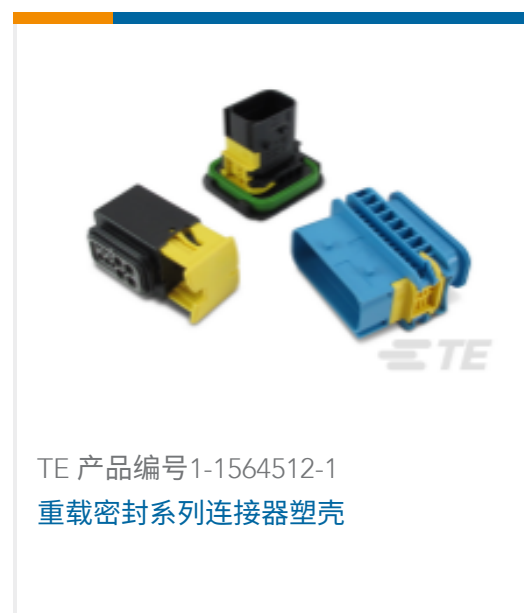
TE 产品编号 1-1564512-1 重载密封系列连接器塑壳