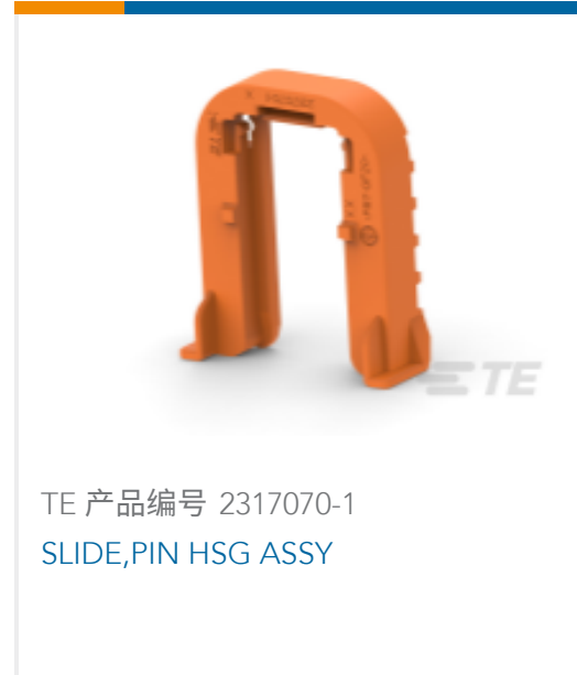
TE 产品编号 2317070-1 SLIDE, PIN HSG ASSY