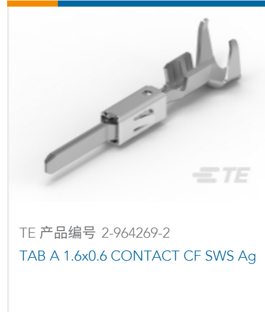
TE 产品编号 2-964269-2 TAB A 1.6x0.6 CONTACT CF SWS Ag