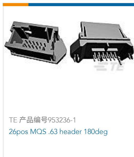
TE 产品编号 953236-1 26pos MQS .63 header 180deg