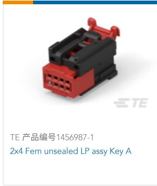
TE 产品编号1456987-1 2x4 Fem unsealed LP assy Key A