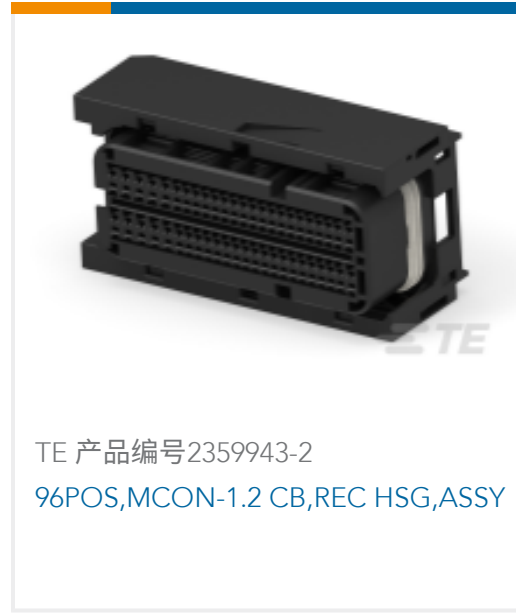
TE 产品编号2359943-2 96POS,MCON-1.2 CB,REC HSG,ASSY