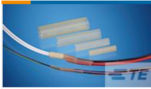
TE 产品编号CB88166002 RBK-VWS-125-NR1-X-100MM