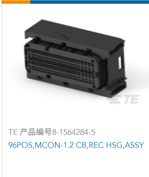
TE 产品编号8-1564284-5 96POS,MCON-1.2 CB,REC HSG,ASSY