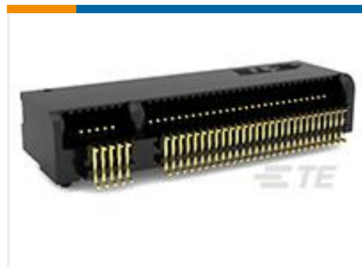
TE 产品编号2199230-4 M.2 0.5PITCH 4.2H KEY E 15U" AU