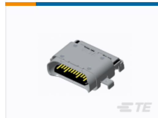
TE 产品编号1-2295018-2 USB TYPE C, REC OFFSET 0.65MM DUAL SMT