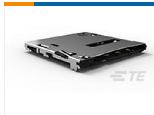
TE 产品编号2174803-2 PUSH-PUSH MICRO SIM CONNECTOR