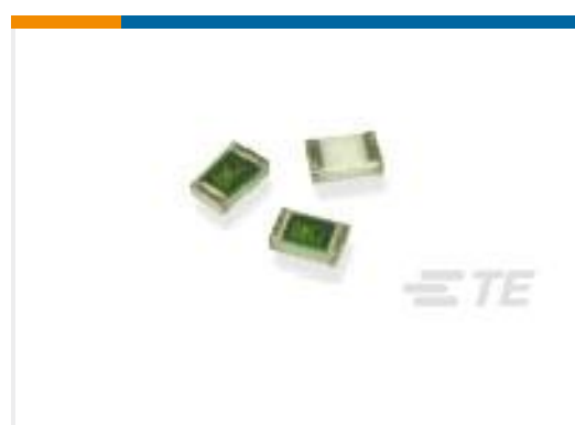
TE 产品编号4-2176091-1 RP 2A 0.25W 150R 0.1% 25PPM 1K RL