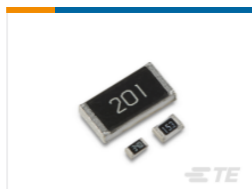
TE 产品编号4-2176325-9 CRGP 0402 100K 1%