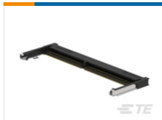
TE 产品编号2309411-1 DDR4 SO DIMM Sockets