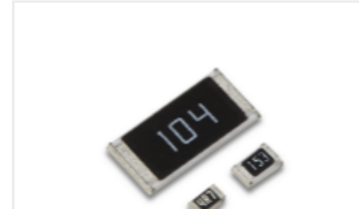
TE 产品编号2176347-6 CRGCQ 2010 27R 1%