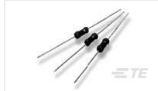
TE 产品编号9-1879352-1 RR02 5% 1K8 AMMO