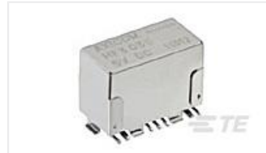
TE 产品编号3-1462051-1 HF3 56S = 50OHM 140MW 12V MONO