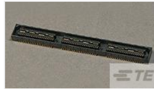
TE 产品编号2-1658012-3 MSB0.80RC-ASY120FL,-,10,-TY