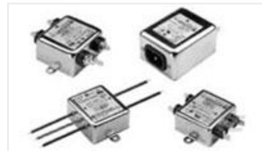
TE 产品编号1-6609027-5 10EK7=F7095 S0