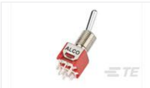
TE 产品编号2267077-1 TMS1T4B5M2RE