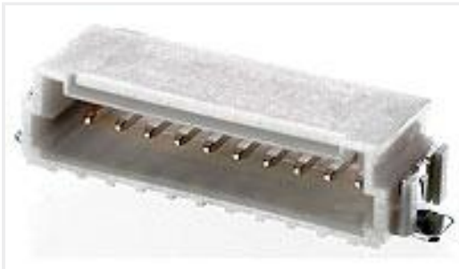
TE 产品编号1-292228-6 1.5 MINI CT SGL H SMT W/O BOSS