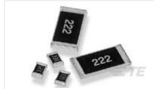
TE 产品编号4-1879499-9 CRGH2010 5% 100R 1W