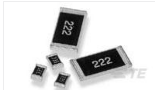
TE 产品编号4-1879499-9 CRGH2010 5% 100R 1W