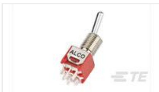
TE 产品编号2267077-1 TMS1T4B5M2RE