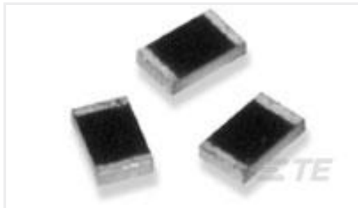
TE 产品编号3-1879280-1 RP 2A 178K 0.1% 15PPM CUT LENG