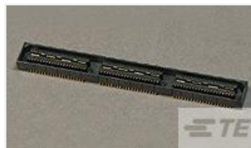
TE 产品编号2-1658012-3 MSB0.80RC-ASY120FL,-,10,-TY