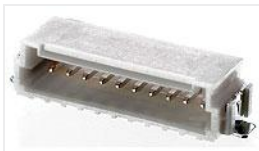
TE 产品编号1-292228-6 1.5 MINI CT SGL H SMT W/O BOSS