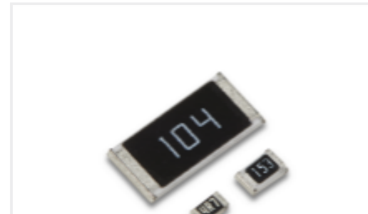
TE 产品编号2176347-6 CRGCQ 2010 27R 1%