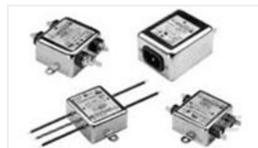
TE 产品编号1-6609027-5 10EK7=F7095 S0