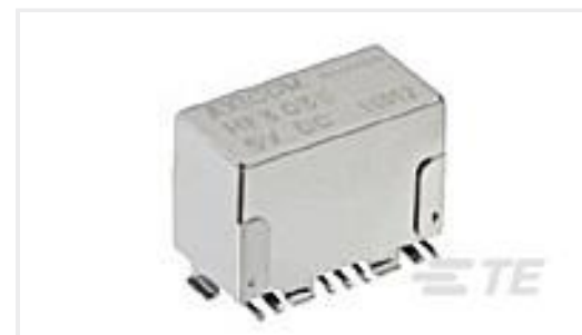
TE 产品编号3-1462051-1 HF3 56S = 50OHM 140MW 12V MONO