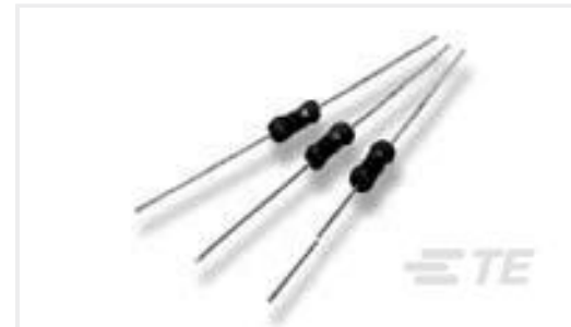
TE 产品编号9-1879352-1 RR02 5% 1K8 AMMO