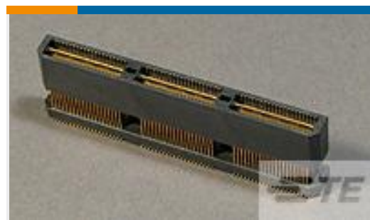
TE 产品编号1658017-3 MSB0.80PL19ASY120FL,-,10,-TY