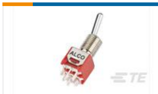
TE 产品编号2267077-1 TMS1T4B5M2RE