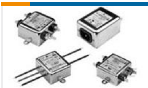
TE 产品编号1-6609027-5 10EK7=F7095 S0