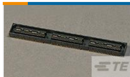
TE 产品编号2-1658012-3 MSB0.80RC-ASY120FL,-,10,-TY