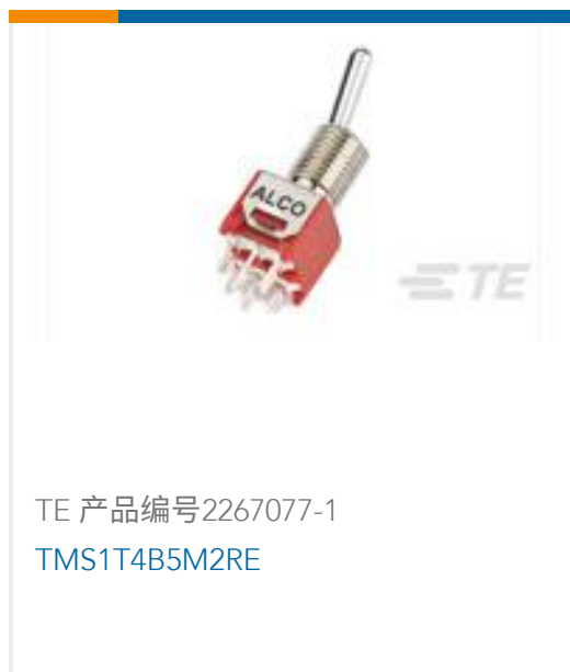
TE 产品编号2267077-1 TMS1T4B5M2RE