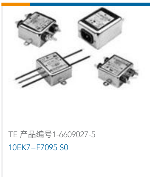
TE 产品编号1-6609027-5 10EK7=F7095 S0