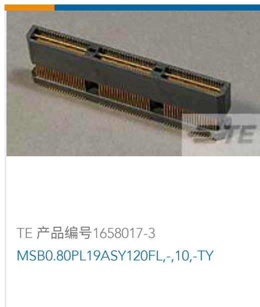
TE 产品编号1658017-3 MSB0.80PL19ASY120FL,-,10,-TY