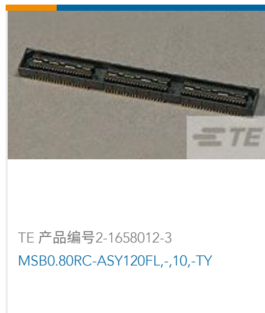
TE 产品编号2-1658012-3 MSB0.80RC-ASY120FL,-,10,-TY