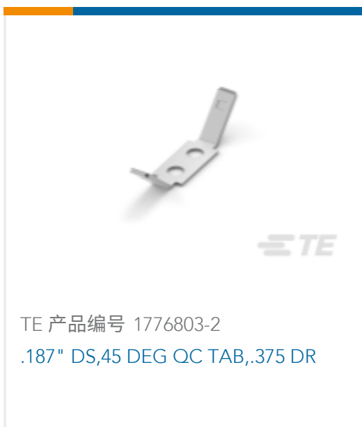
TE 产品编号 1776803-2 .187" DS,45 DEG QC TAB,.375 DR