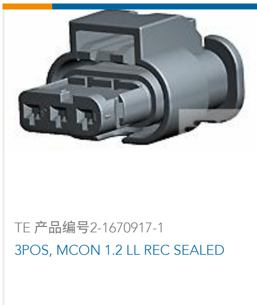
TE 产品编号2-1670917-1 3POS, MCON 1.2 LL REC SEALED