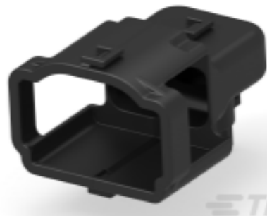
TE 产品编号 2367200-2 REC CONN CVR,8POS,MQS