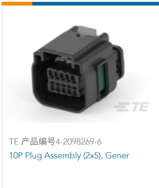
TE 产品编号4-2098269-6 10P Plug Assembly (2x5), Gener