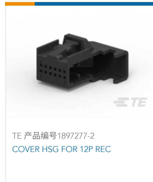
TE 产品编号1897277-2 COVER HSG FOR 12P REC