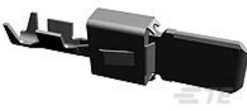
TE 产品编号1-963736-1 TAB 5.8x0.8 CONTACT CS SRC Sn