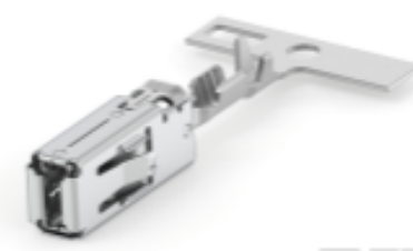
TE 产品编号1564982-1 AMP MCP 2.8K, CONTACT