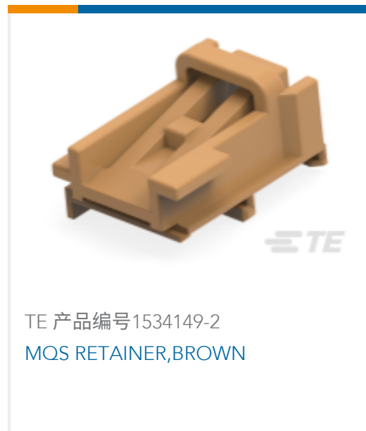
TE 产品编号1534149-2 MQS RETAINER, BROWN