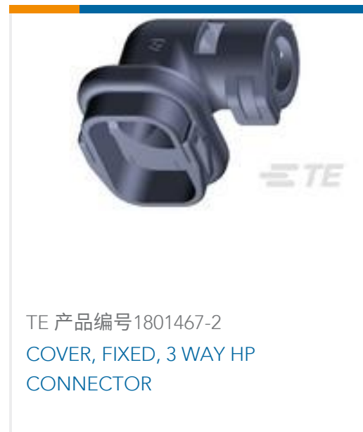
TE 产品编号1801467-2 COVER, FIXED, 3 WAY HP CONNECTOR