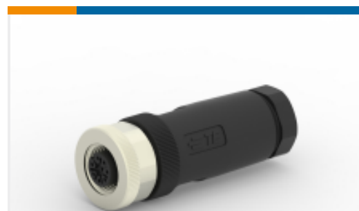
TE 产品编号T4110002081-000 M12,FEMALE,STRAIGHT,A CODE,8P, PG9,GOLD