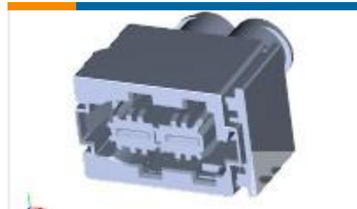
TE 产品编号1355328-1 2POS,AMP MCP 9.5,REC HSG ASSY, SLD