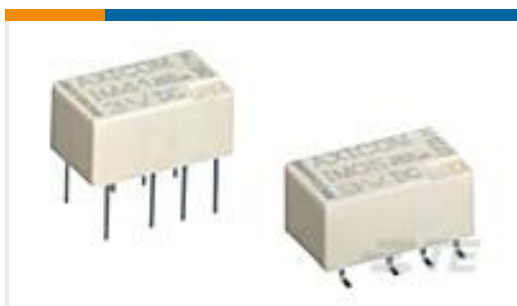
TE 产品编号5-1462039-8 IM02PNS=IM RELAY 140mW 4.5V