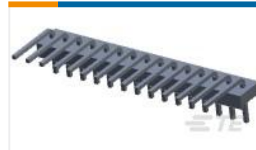
TE 产品编号1-640453-5 15P MTA100 HDR ASSY SQ R/A