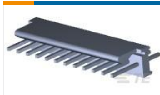
TE 产品编号1-640456-2 12P MTA100 HDR ASSY F/L SQ STR