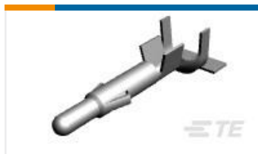
TE 产品编号926894-3 UNIV.M-N-L.PIN