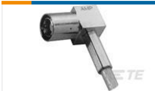
TE 产品编号5414363-3 PLUG,CABLE,RTANG,SMB, PB FREE