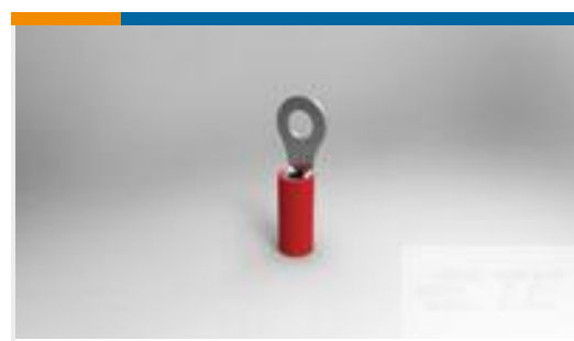
TE 产品编号51863 TERM, R, PIDG, 22-16/22-18, #6(M3.5)