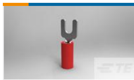
TE 产品编号34541 PIDG SPD 22-16 COMM 22-18MIL 6