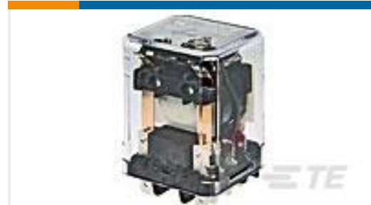
TE 产品编号8-1393113-5 KUEP-11D15-110=KU