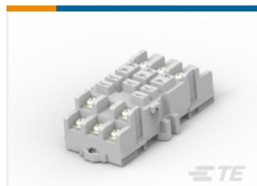
TE 产品编号2-1419106-5 27E893=SOCKET,KU,11,OC,POLY,NA-