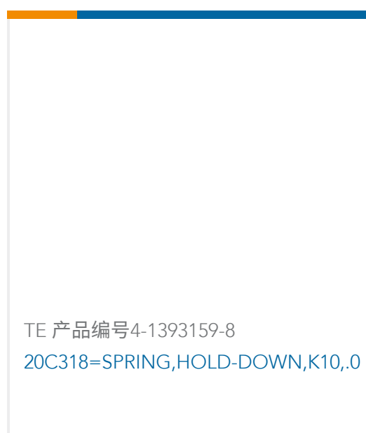
TE 产品编号4-1393159-8 20C318=SPRING,HOLD-DOWN,K10,0