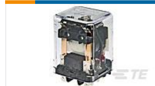
TE 产品编号8-1393113-8 KUEP-11D15-48=KU