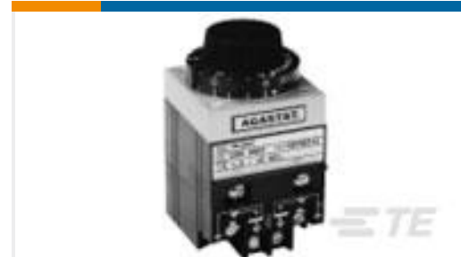
TE 产品编号1-1423159-9 7012PB=RLY,STD,ON,2P,125VDC, 5