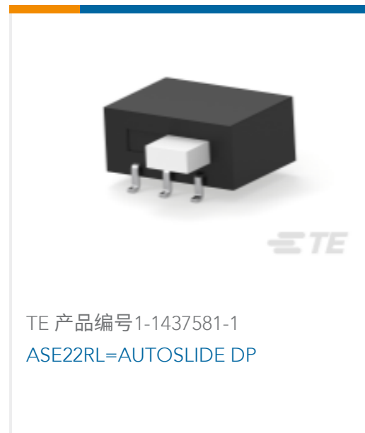
TE 产品编号1-1437581-1 ASE22RL=AUTOSLIDE DP 0.3W