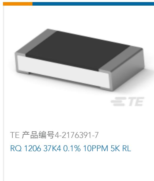
TE 产品编号4-2176391-7 RQ 1206 37K4 0.1% 10PPM 5K RL