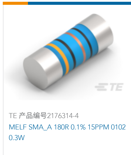
TE 产品编号2176314-4 MELF SMA_A 180R 0.1% 15PPM 0102 0.3W