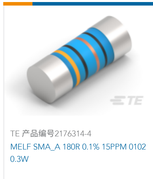
TE 产品编号2176314-4 MELF SMA_A 180R 0.1% 15PPM 0102 0.3W