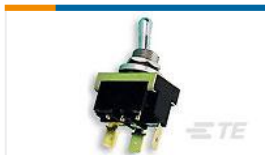
TE 产品编号3-6437592-9 AWTP1504