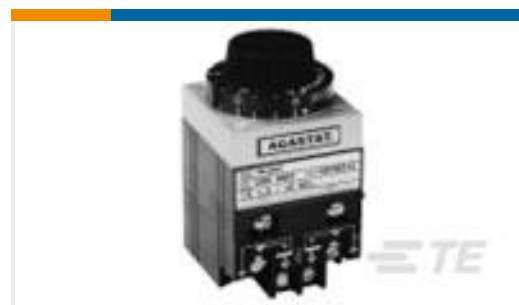
TE 产品编号8-1472969-9 7022X3BT=RLY,STD,OFF,2P,110V,5S,T