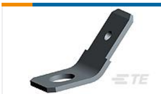
TE 产品编号140814-1 250 FASTON,TAB,BR