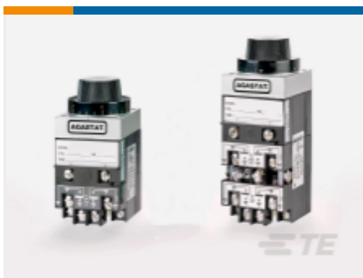
TE 产品编号 2-1423159-6 7012PD=RLY,STD,ON,2P,125VDC,50