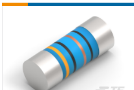
TE 产品编号2176314-4 MELF SMA_A 180R 0.1% 15PPM 0102 0.3W