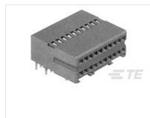
TE 产品编号5-103911-3 60 SYSTEM 50 RCPT ASSY DRRA