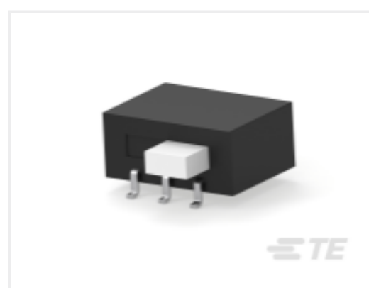
TE 产品编号1-1437581-1 ASE22RL=AUTOSLIDE DP