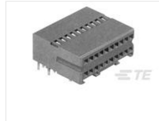
TE 产品编号5-103911-3 60 SYSTEM 50 RCPT ASSY DRRA