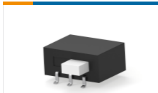
TE 产品编号1-1437581-1 ASE22RL=AUTOSLIDE DP 0.3W