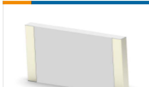
TE 产品编号7-2176246-6 CRGS2512 5% 1M8