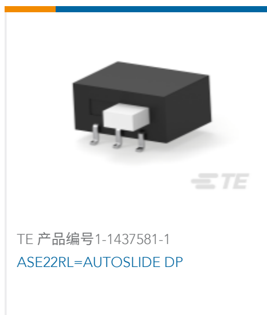
TE 产品编号1-1437581-1 ASE22RL=AUTOSLIDE DP