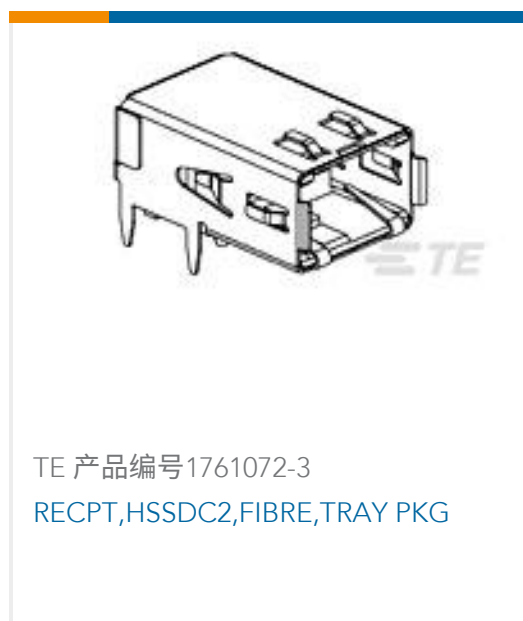
TE 产品编号1761072-3 RECPT,HSSDC2,FIBRE,TRAY PKG