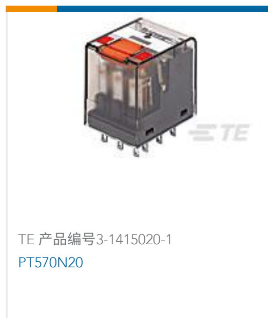
TE 产品编号3-1415020-1 PT570N20