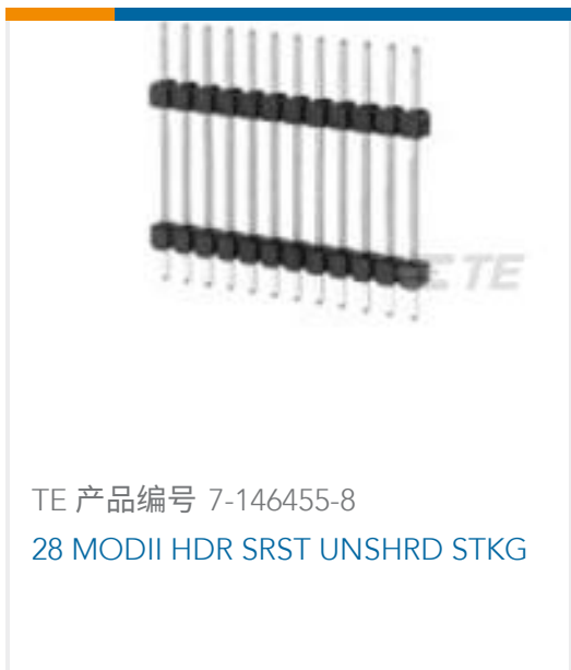
TE 产品编号 7-146455-8 28 MODII HDR SRST UNSHRD STKG