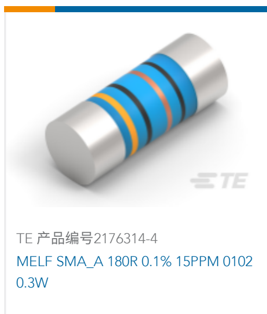
TE 产品编号2176314-4 MELF SMA_A 180R 0.1% 15PPM 0102 0.3W