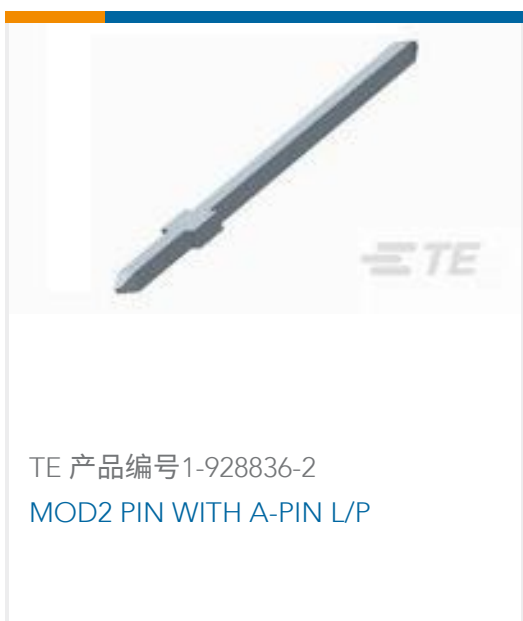
TE 产品编号1-928836-2 MOD2 PIN WITH A-PIN L/P