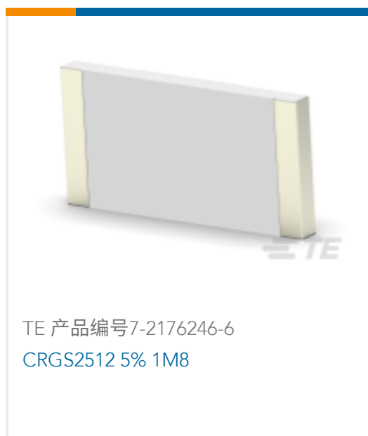
TE 产品编号7-2176246-6 CRGS2512 5% 1M8