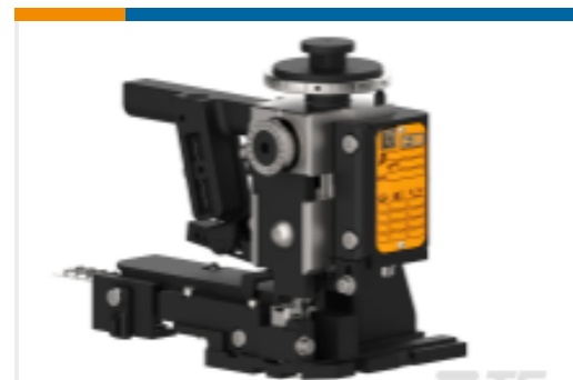
TE 产品编号2836077-1 OCEAN_2.0_Applicator-S-070F100O-RSM