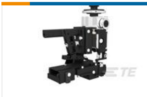
TE 产品编号2151582-1 OCEAN_2.0_Applicator-S-110F165O-RSM