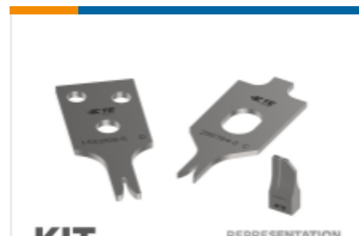
TE 产品编号7-2837932-7 OCEAN_2.0_SPARE_PART_KIT-062F091O