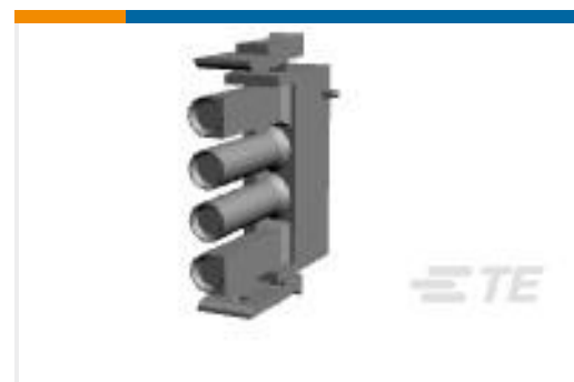
TE 产品编号926298-5 UN-MNL STECK-GEH 4P