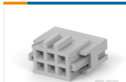
TE 产品编号215882-6 AMP-LATCH MIL TYPE RCPT CONNECTOR