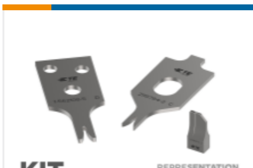
TE 产品编号7-2266813-7 OCEAN_2.0_SPARE_PART_KIT-055F062F