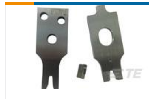
TE 产品编号7-2150373-7 OCEAN-055F080F-CRIMPTOOLINGKIT