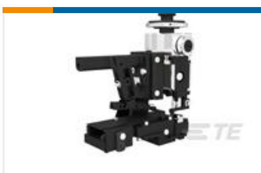
TE 产品编号2151757-1 OC-AT-S-FM-100F155F-001-0331