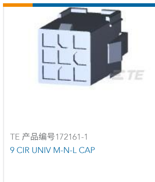
TE 产品编号172161-1 9 CIR UNIV M-N-L CAP