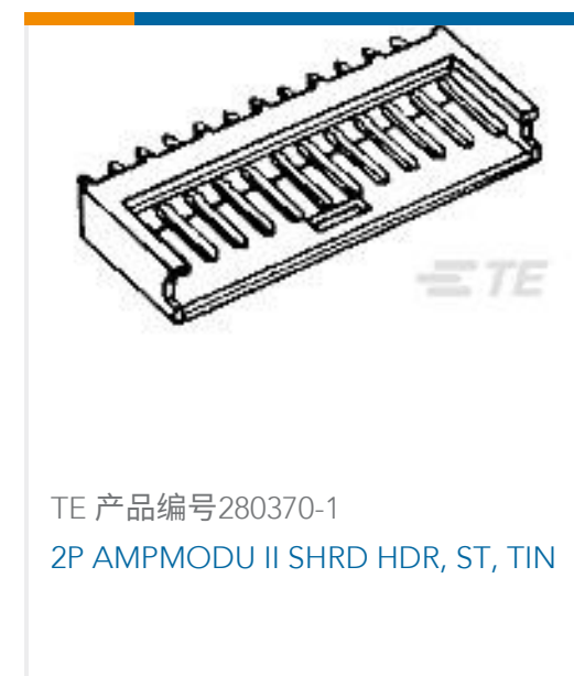
TE 产品编号280370-1 2P AMPMODU II SHRD HDR, ST, TIN