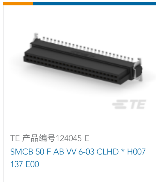
TE 产品编号124045-E SMCB 50 F AB VV 6-03 CLHD * H007 137 E00