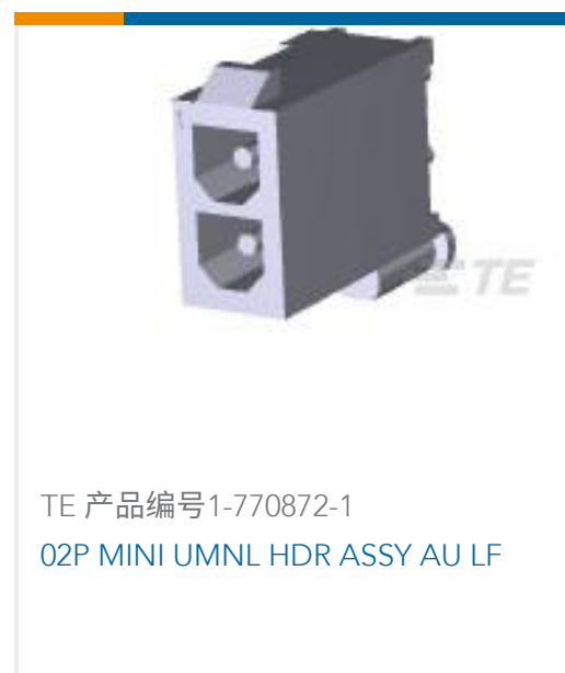
TE 产品编号1-770872-1 02P MINI UMNL HDR ASSY AU LF