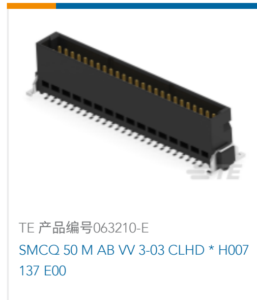
TE 产品编号063210-E SMCQ 50 M AB VV 3-03 CLHD * H007 137 E00