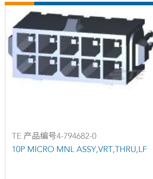
TE 产品编号4-794682-0 10P MICRO MNL ASSY,VRT,THRU,LF