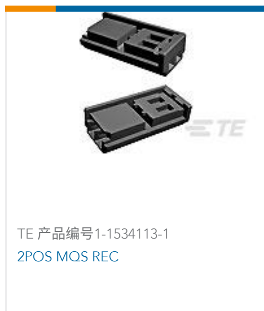
TE 产品编号1-1534113-1 2POS MOS REC