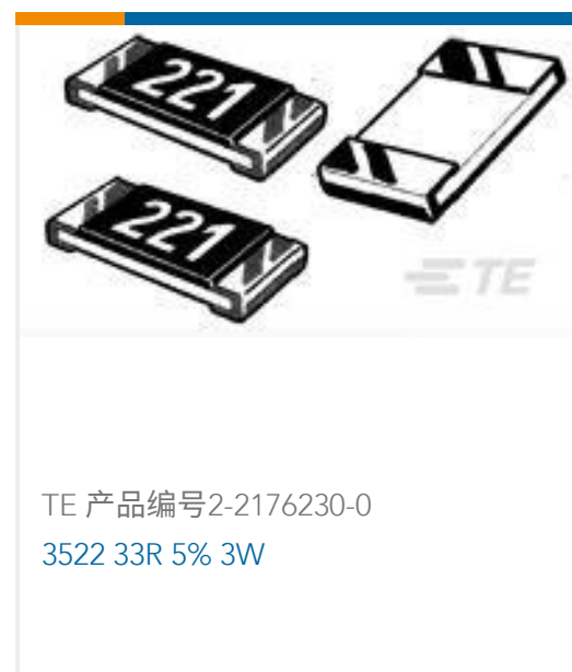
TE 产品编号2-2176230-0 3522 33R 5% 3W