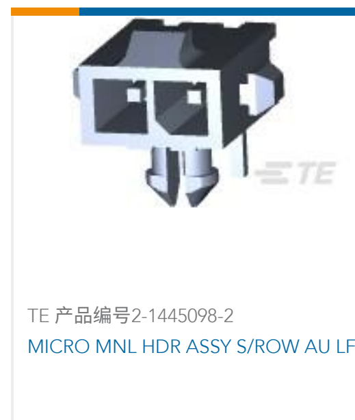
TE 产品编号2-1445098-2 MICRO MNL HDR ASSY S/ROW AU LF