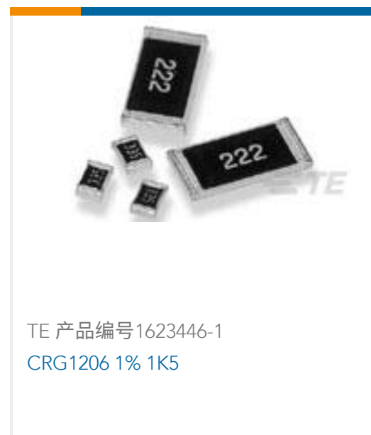
TE 产品编号1623446-1 CRG1206 1% 1K5