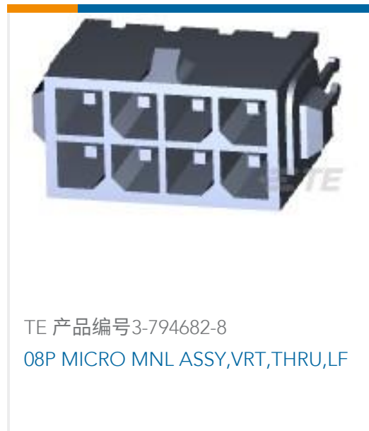
TE 产品编号3-794682-8 08P MICRO MNL ASSY,VRT,THRU,LF