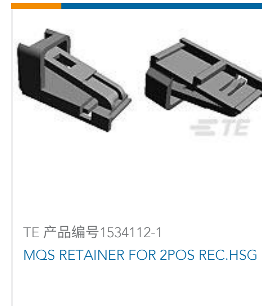
TE 产品编号1534112-1 MOS RETAINER FOR 2POS REC.HSG