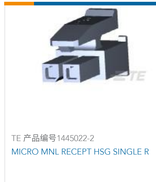
TE 产品编号1445022-2 MICRO MNL RECEPT HSG SINGLE R