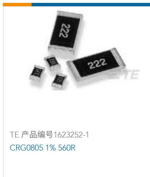
TE 产品编号1623252-1 CRG0805 1% 560R