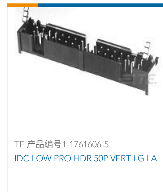
TE 产品编号1-1761606-5 IDC LOW PRO HDR 50P VERT LG LA