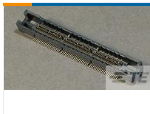
TE 产品编号767114-3 MICT,REC,114,ASY,.025,TAPE,CAP