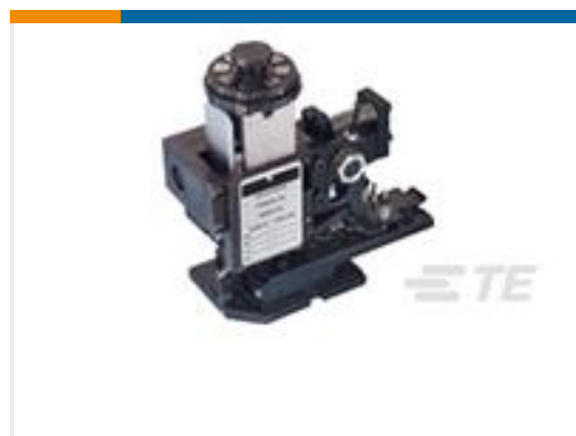
TE 产品编号680184-3 HDM SPA 9EAPR180F G