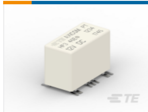
TE 产品编号3-1462050-6 HF3 46E=75 OHM 300MW 12V bi 2c