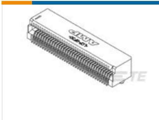
TE 产品编号1658198-1 70 POSN,0.8MM PITCH, SURFACE T