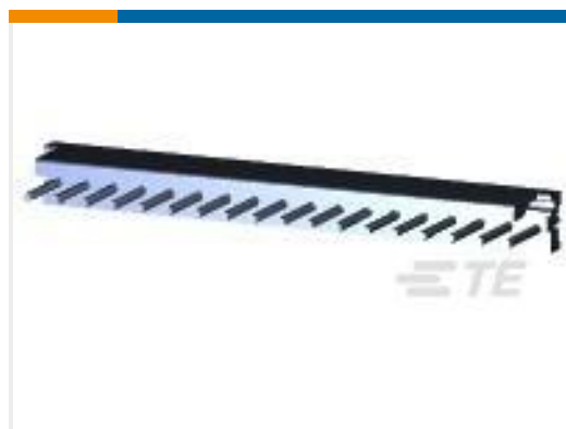
TE 产品编号4-641120-8 18P MTA156 HDR ASSY FL/ST LF