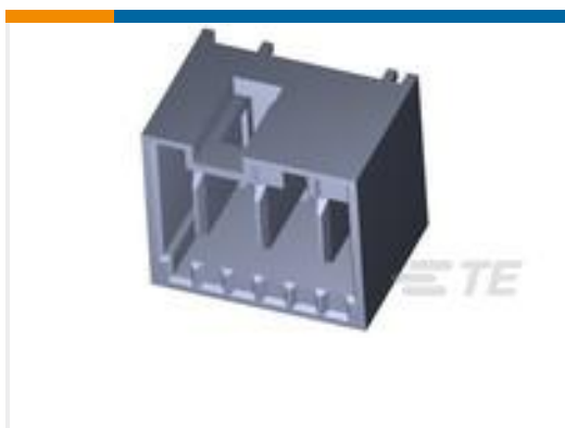
TE 产品编号3-1971846-3 3P, RAST 5 Tab Header, THV