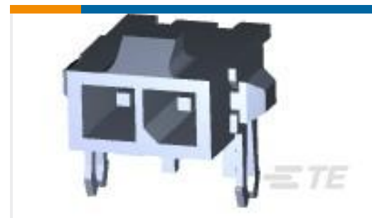
TE 产品编号2-1445088-2 MICRO MNL HDR ASSY S/ROW AU LF