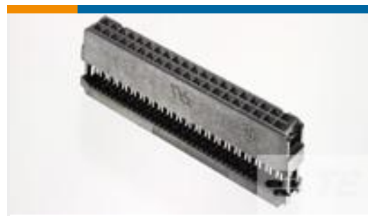
TE 产品编号1658623-9 40 NOVO MIL 30DP, LEAD FREE