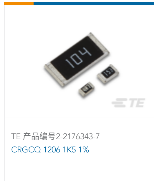
TE 产品编号2-2176343-7 CRGCQ 1206 1K5 1%