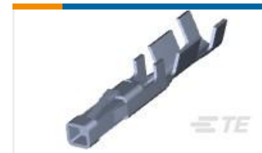
TE 产品编号794606-3 MICRO MNL RPT CNT STRIP 30AU