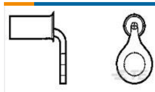
TE 产品编号184269-1 SOLISTRAND 16-14HD 90 RING 8