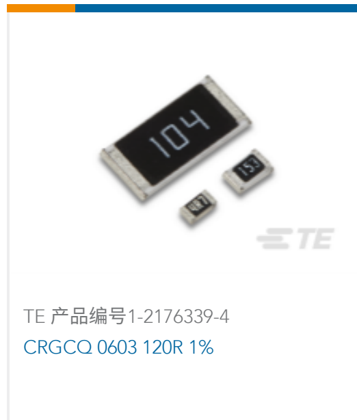
TE 产品编号1-2176339-4 CRGCQ 0603 120R 1%