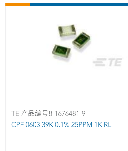
TE 产品编号8-1676481-9 CPF 0603 39K 0.1% 25PPM 1K RL