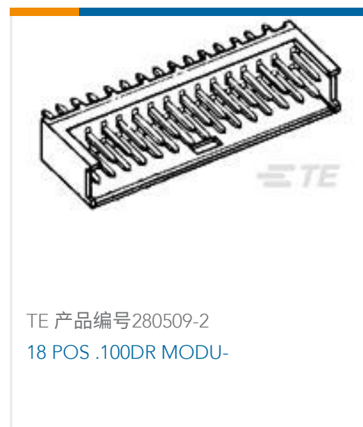
TE 产品编号280509-2 18 POS .100DR MODU-