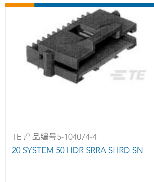
TE 产品编号5-104074-4 20 SYSTEM 50 HDR SRRA SHRD SN