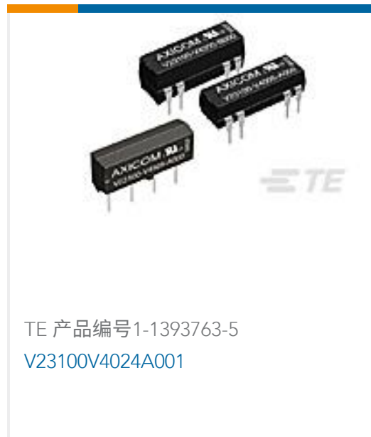
TE 产品编号1-1393763-5 V23100V4024A001