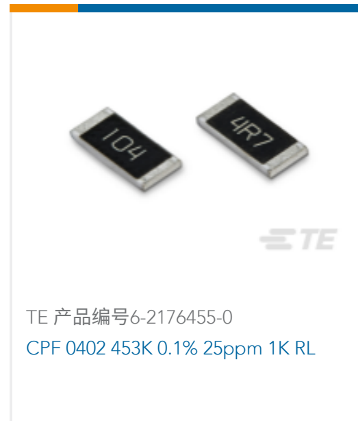
TE 产品编号6-2176455-0 CPF 0402 453K 0.1% 25ppm 1K RL