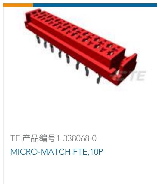
TE 产品编号1-338068-0 MICRO-MATCH FTE,10P