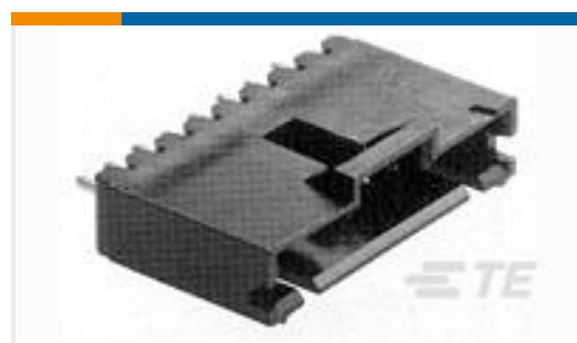
TE 产品编号5-104363-4 05 MTE HDR SRST LATCH .100CL