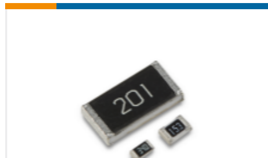
TE 产品编号2-2176326-3 CRGP 0603 680R 1%