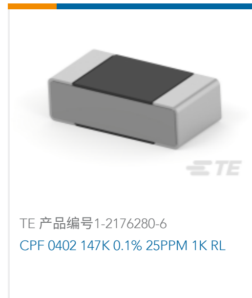
TE 产品编号1-2176280-6 CPF 0402 147K 0.1% 25PPM 1K RL