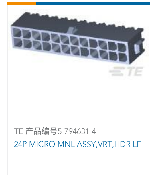
TE 产品编号5-794631-4 24P MICRO MNL ASSY,VRT,HDR LF