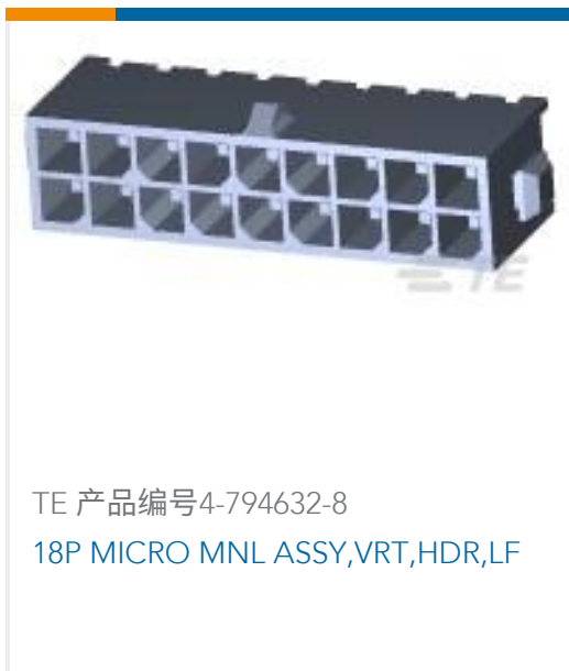
TE 产品编号4-794632-8 18P MICRO MNL ASSY,VRT,HDR,LF