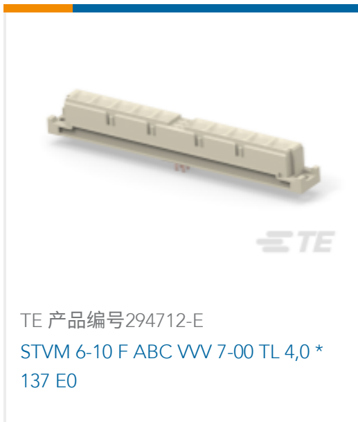
TE 产品编号294712-E STVM 6-10 F ABC VV 7-00 TL 4,0 * 137 E0