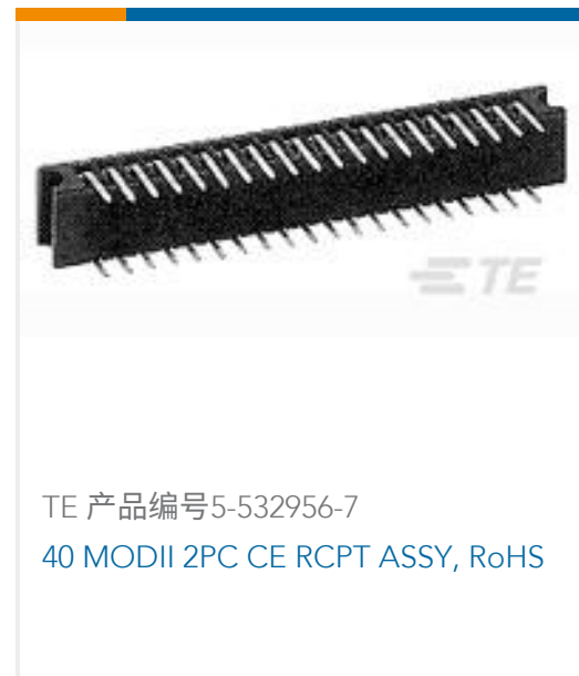
TE 产品编号5-532956-7 40 MODII 2PC CE RCPT ASSY, RoHS