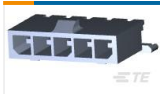
TE 产品编号2-1445084-5 micro mnl hdr assy s/row au lf