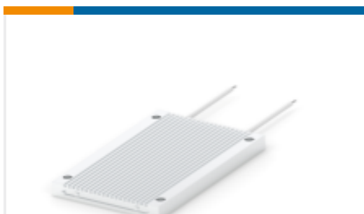
TE 产品编号1-2176249-5 TJT 300W 220R 5%