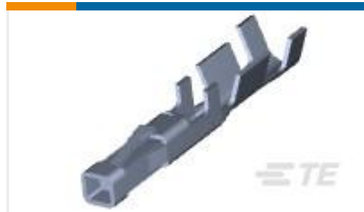
TE 产品编号1-794606-1 MICRO MNL RPT CNT STRP 15AU LF