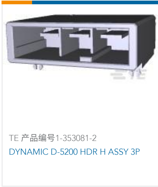
TE 产品编号1-353081-2 DYNAMIC D-5200 HDR H ASSY 3P