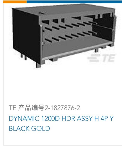
TE 产品编号2-1827876-2 DYNAMIC 1200D HDR ASSY H 4P Y BLACK GOLD