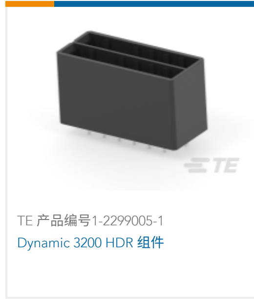
TE 产品编号1-2299005-1 Dynamic 3200 HDR 组件