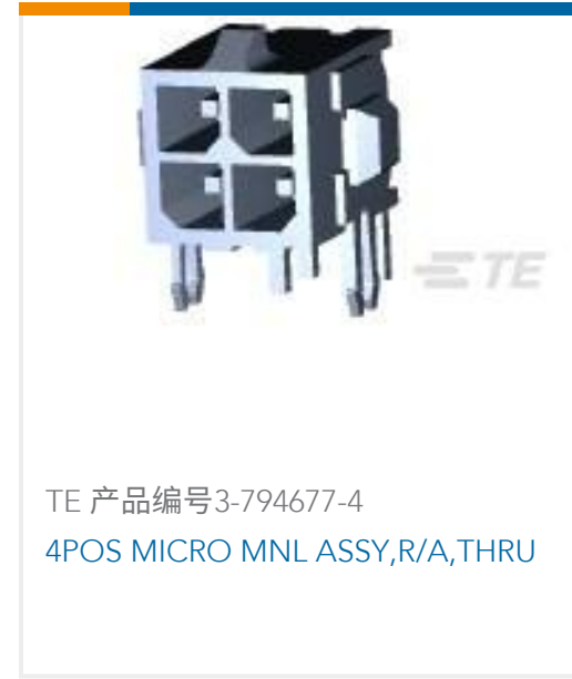
TE 产品编号3-794677-4 4POS MICRO MNL ASSY,R/A,THRU