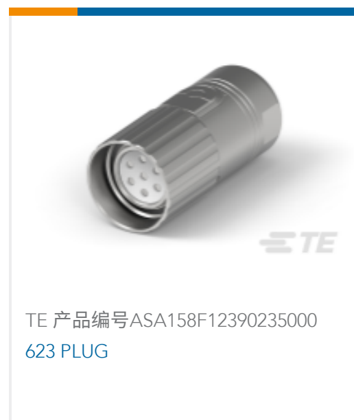
TE 产品编号ASA158F12390235000 623 PLUG