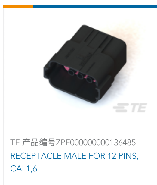
TE 产品编号ZPF000000000136485 RECEPTACLE MALE FOR 12 PINS, CAL1,6