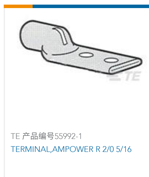
TE 产品编号55992-1 TERMINAL, AMP POWER R 2/0 5/16