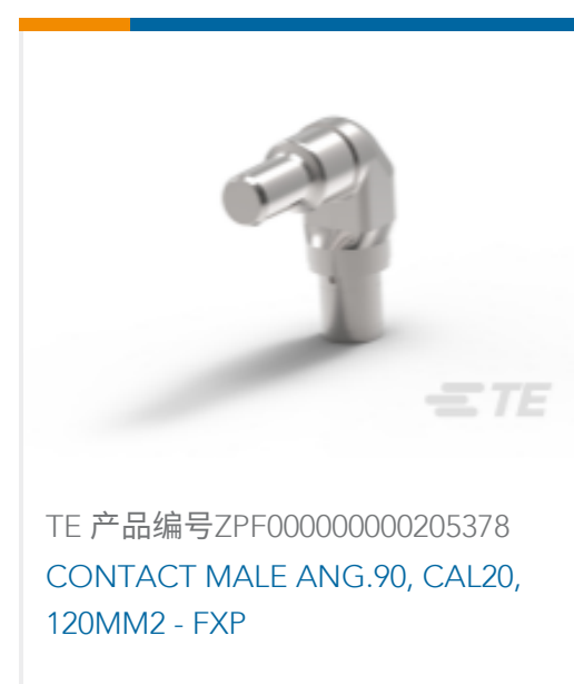
TE 产品编号ZPF000000000205378 CONTACT MALE ANG.90, CAL20, 120MM2 - FXP