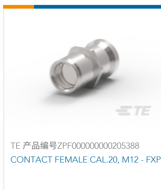
TE 产品编号ZPF000000000205388 CONTACT FEMALE CAL.20, M12 - FXP