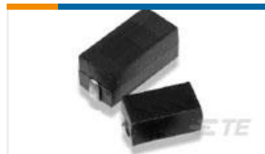
TE 产品编号6-1879233-5 SMW5 47R 5%