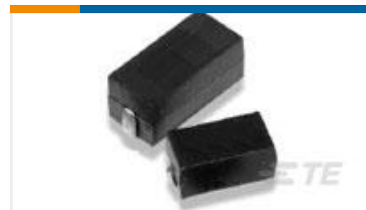
TE 产品编号5-1879021-3 SMW3 15R 5%