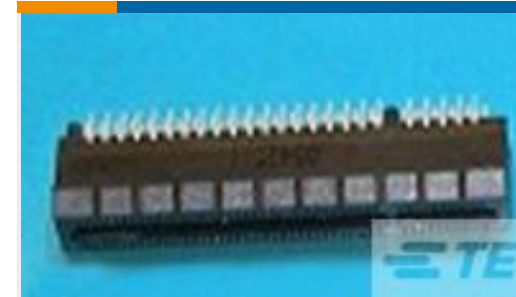
TE 产品编号5650118-2 CONN SEC II 10 POS 100C/L R/A