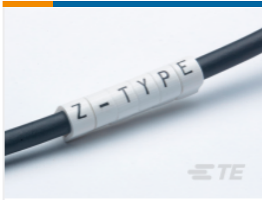
TE 产品编号EC0437-000 06153411