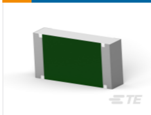
TE 产品编号2176398-2 3502 15K 1%