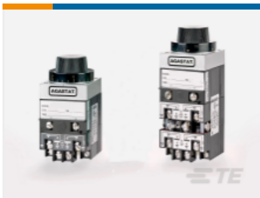
TE 产品编号7-1472995-0 7012WDS=RLY,STD,ON,2P,96V,50S,S