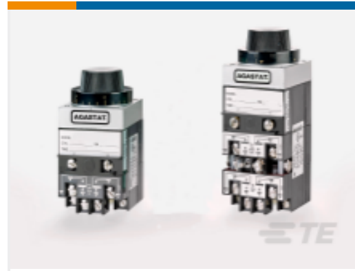
TE 产品编号1755170-1 7022OCIM=RLY,STD,OFF,2P,24V,15S,I, M