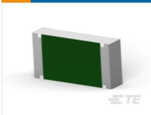
TE 产品编号9-2176397-8 3502 11K 1%