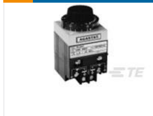
TE 产品编号6-1755142-4 7022WDIM=RLY,STD,OFF,2P,96V,50S,I, M