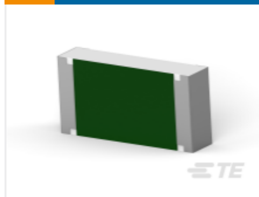
TE 产品编号1-2176398-4 3502 47K 1%