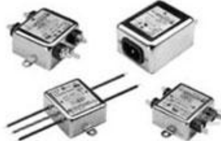
TE 产品编号1-6609027-5 10EK7=F7095 S0