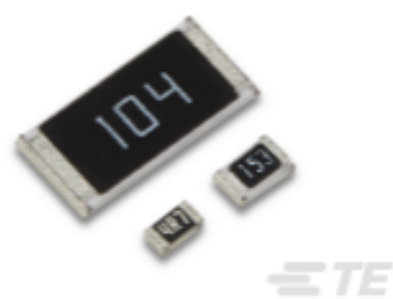
TE 产品编号2176347-6 CRGCO 2010 27R 1%