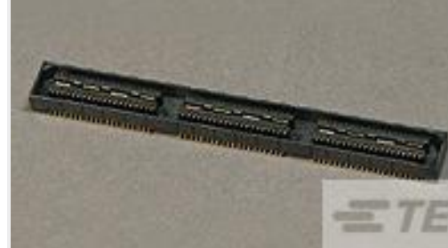
TE 产品编号2-1658012-3 MSB0.80RC-ASY120FL-,10,-TY