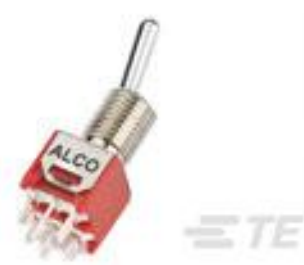
TE 产品编号2267077-1 TMS1T4B5M2RE