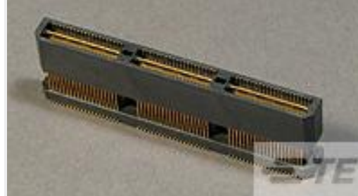
TE 产品编号1658017-3 MSB0.80PL19ASY120FL-,10,-TY