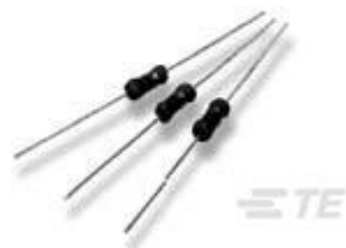
TE 产品编号9-1879352-1 RR02 5% 1K8 AMMO