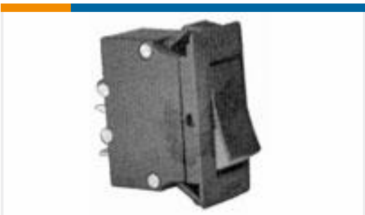
TE 产品编号3-1423673-9 W51-A152A1-5=CKTBKR,THERM,ROC