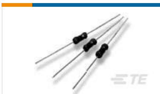
TE 产品编号3-1879354-2 RR03 5% 6R2 AMMO