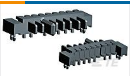
TE 产品编号1827654-2 2mm pitch Battery Plug Assy. 7P. H=4.0