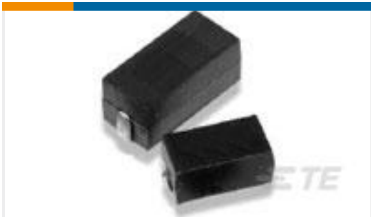
TE 产品编号1879234-7 SMF5 910R 5%