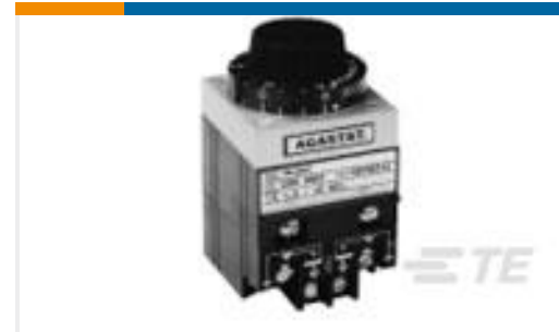
TE 产品编号1423157-2 7012AB=RLY,STD,ON,2P,120VAC,5S