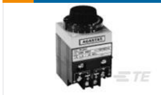
TE 产品编号1423162-8 7022ADT=RLY,STD,OFF,2P,120VAC