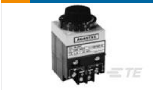
TE 产品编号1-1423159-9 7012PB=RLY,STD,ON,2P,125VDC, 5