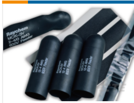
TE 产品编号223092-000 MCK-4V