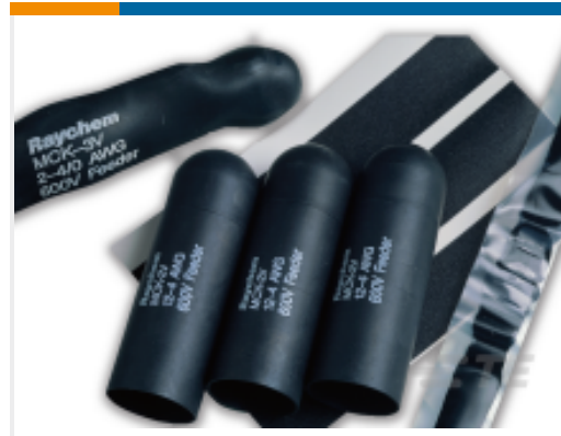
TE 产品编号840744-000 MCK-2V