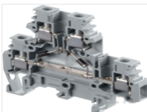
TE 产品编号 1SNA115327R1200 M4/6.DE2.D