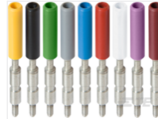
TE 产品编号 1SNA179726R0200 AJS9