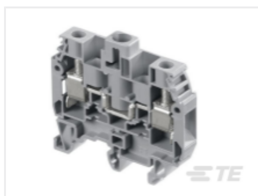
TE 产品编号 1SNA115500R2500 M6/8.STP3