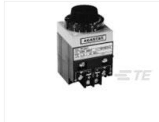
TE 产品编号 1423165-3 7024AC=RLY,STD,OFF,4P,120VAC,1