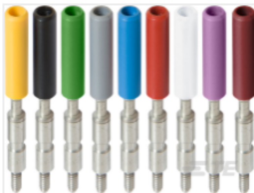
TE 产品编号 1SNA206720R1400 AJS9-RD