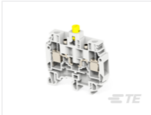
TE 产品编号 1SNA115277R2000 M6/8.STP