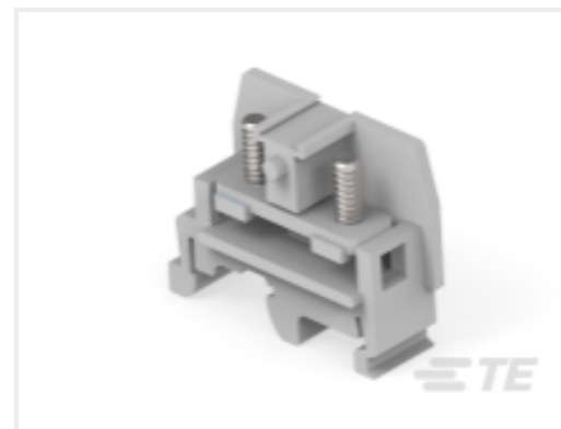
TE 产品编号 1SNA115511R0300 M6/12.FF