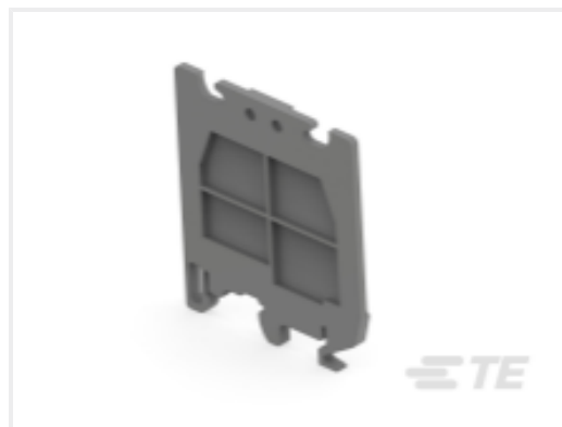
TE 产品编号 1SNA114825R0500 SCFM6