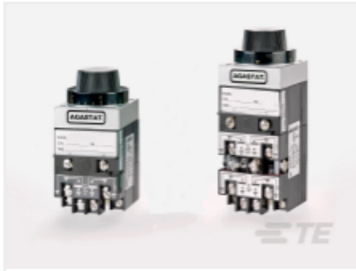
TE 产品编号 1-1423159-9 7012PB=RLY,STD,ON,2P,125VDC, 5