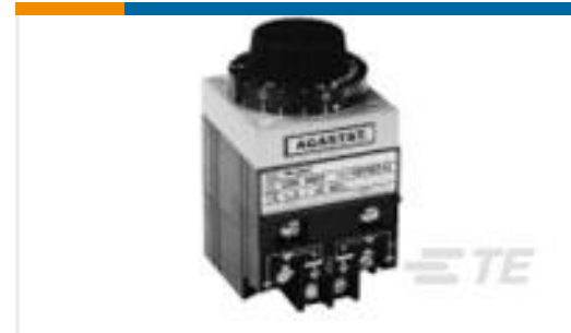
TE 产品编号1423162-9 7022AE=RLY,STD,OFF,2P,120VAC,2