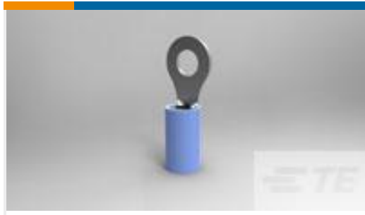
TE 产品编号320560 TERMINAL,PIDG R 16-14 8