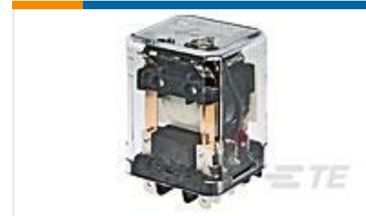
TE 产品编号9-1393113-7 KUJEP-3D15-110=KU