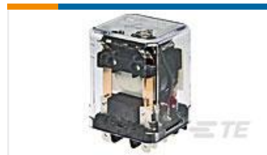
TE 产品编号4-2027183-3 KUJEP-11D15-125=RELAY,3A,2C, AGCDO,OC.187,