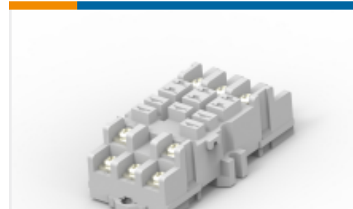
TE 产品编号2-1419106-5 27E893=SOCKET,KU,11,OC,POLY,NA-