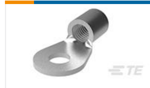
TE 产品编号52197 TERMINAL,SOLIS R 6 10