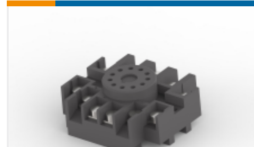
TE 产品编号2-1419106-4 27E892=SOCKET,KRPA,11,OCTAL,PO