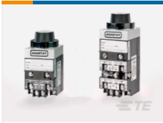
TE 产品编号 2-1423162-9 7022BK=RLY,STD,OFF,M2P,240VAC,