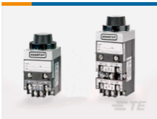
TE 产品编号7-1472995-0 7012WDS=RLY,STD,ON,2P,96V,50S,S