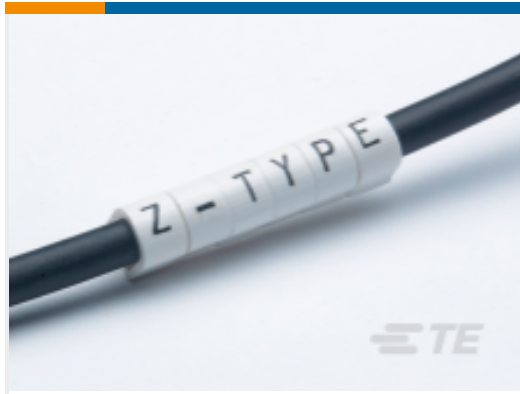
TE 产品编号EC0437-000 06153411