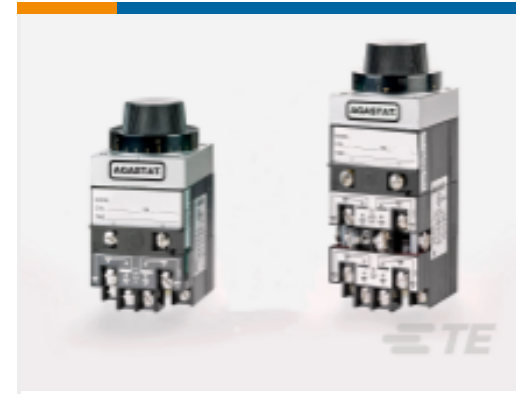
TE 产品编号1755170-1 7022OCIM=RLY,STD,OFF,2P,24V,15S,I, M