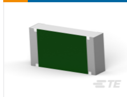
TE 产品编号1-2176398-4 3502 47K 1%