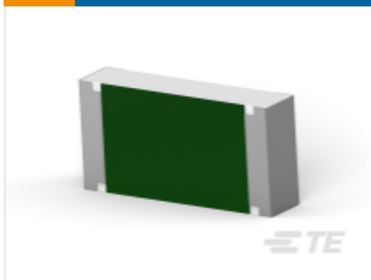
TE 产品编号9-2176397-8 3502 11K 1%