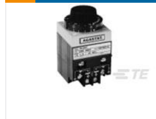
TE 产品编号6-1755142-4 7022WDIM=RLY,STD,OFF,2P,96V,50S,I, M