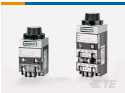
TE 产品编号 1423162-5 7022AC=RLY,STD,OFF,2P 120VAC,1