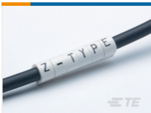
TE 产品编号EC0437-000 06153411