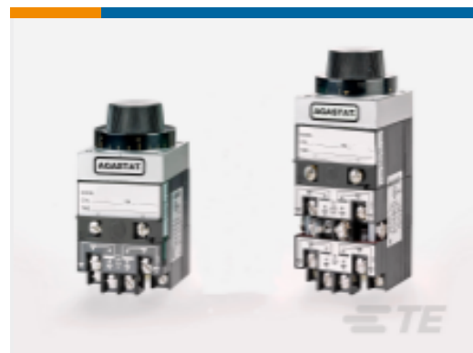
TE 产品编号1755170-1 7022OCIM=RLY,STD,OFF,2P,24V,15S,I, M