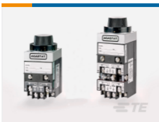
TE 产品编号 1-1423162-8 7022AK=RLY,STD,OFF,2P,120VAC,1