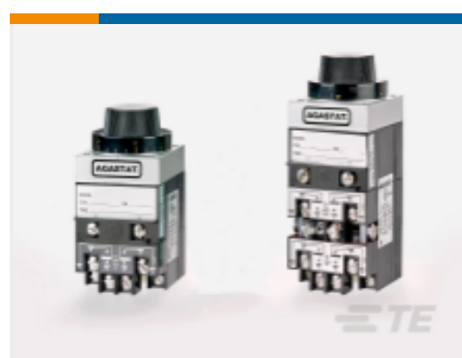
TE 产品编号 1755170-1 7022OCIM=RLY,STD,OFF,2P,24V,15S,I, M