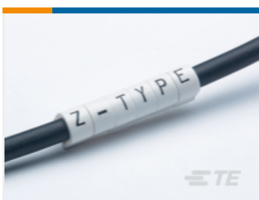
TE 产品编号 EC0437-000 06153411