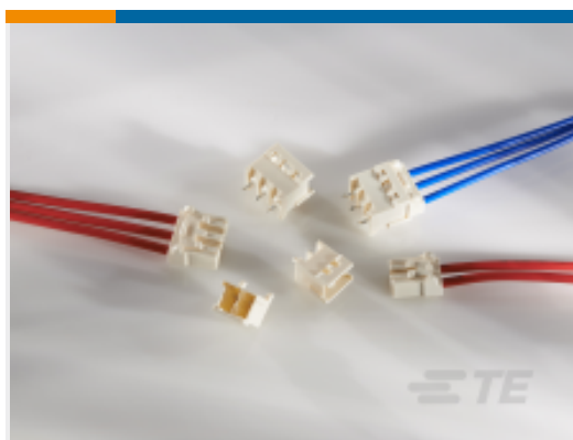
TE 产品编号3-2232876-1 GIC6.0MM CONNECTOR HEAD HOUSING ASS 3POS