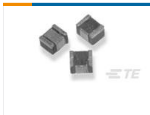
TE 产品编号1624112-4 3650 0603 27nH 5% 2K RL