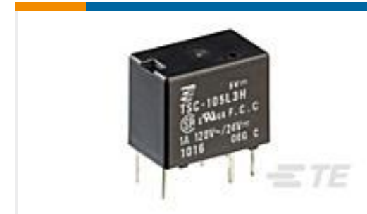
TE 产品编号5-1440007-3 TSC-124D3H,000