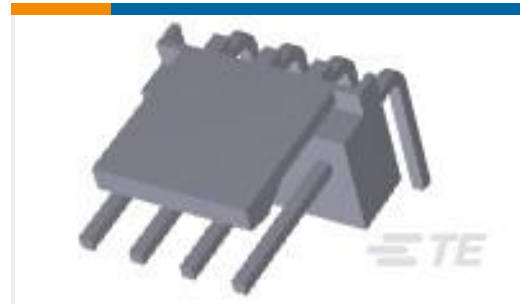
TE 产品编号3-647630-4 04P MTA100 HRD ASSY F/L LF