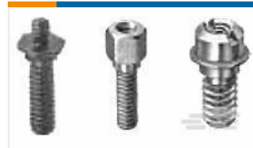
TE 产品编号749087-2 50SR SCREWLOCK KIT,FEMALE