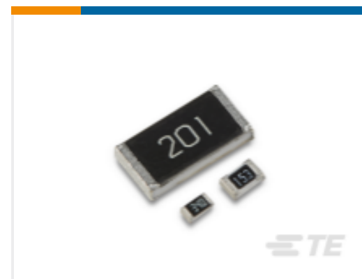
TE 产品编号1-2176330-4 CRGP 2010 120R 1%