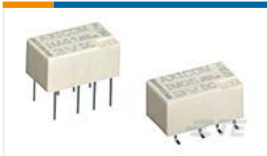
TE 产品编号1462039-2 IM07CGR=IM RELAY 200mW 24V HDV