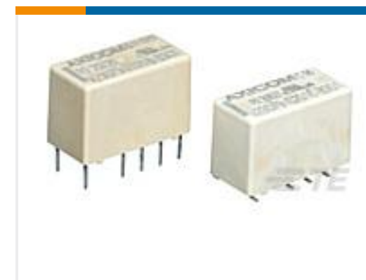
TE 产品编号1-1393788-1 V23079A1003B301