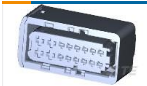
TE 产品编号3-1564337-1 16POS, MIXED,REC HSG,ASSY