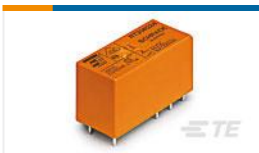
TE 产品编号1649357-1 RTH14005