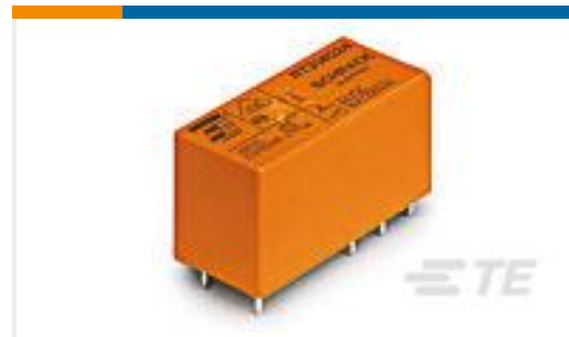
TE 产品编号1-1649328-5 RT314024