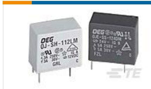
TE 产品编号4-1419144-4 OJ-SS-124LMH,000