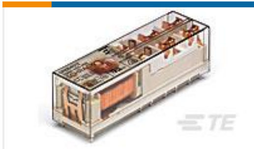
TE 产品编号1393260-4 SR6B4012 - V23050-A1012-A542